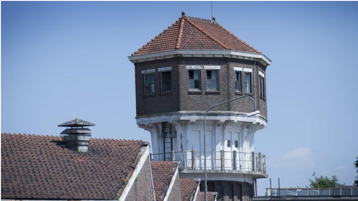
De Watertoren blijft behouden.

Het rijke textielverleden van het uitgestrekte fabriekscomplex van Koninklijke Ten Cate is één van de inspiratiebronnen bij de vernieuwing van deze bijzondere plek en bepaalt de identiteit van de locatie. Het behoud van het historisch gebouwen is een belangrijk uitgangspunt voor Indië, evenals het behoud van bestaand groen en het historisch wegenpatroon. Er komen drie nieuwe waterbekkens waar gewoond, gewerkt en gerecreëerd kan worden.