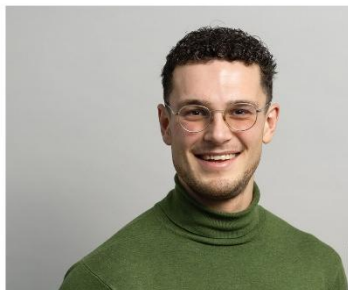
Young Twente Board