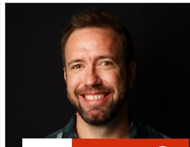
roc van twente ondernemerslab twente